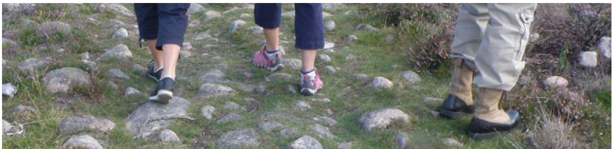
I delar av reservatet fanns iordninggjorda promenadstigar, lämpade för barnvagnar och rullatorer. För den som så önskar finns det också lite mer ostadiga underlag.