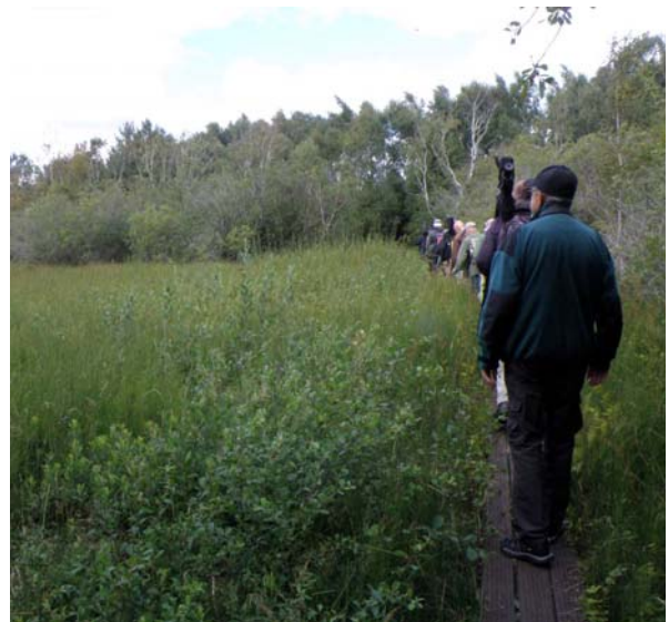
Här fanns inte bara klapperstensfält.