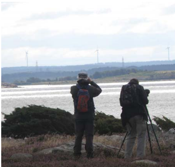
Medan andra kikare var igång...