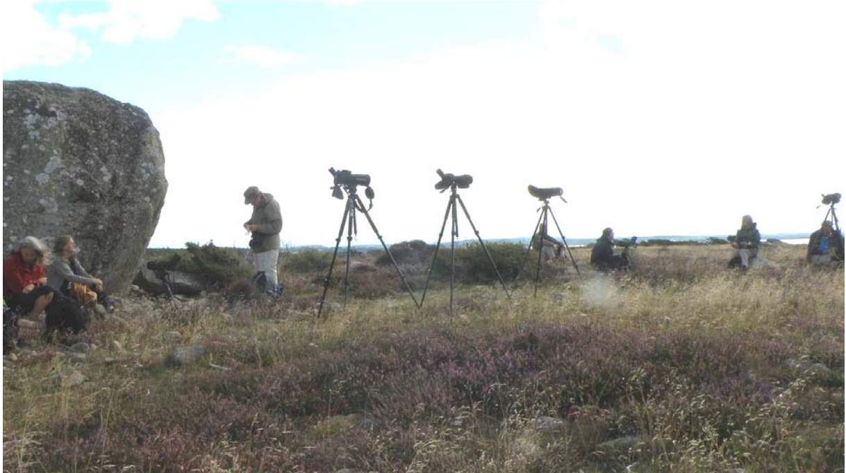
Lunchrast vid Den Stora Stenen, när tubkikarna fick vila sig en liten stund.