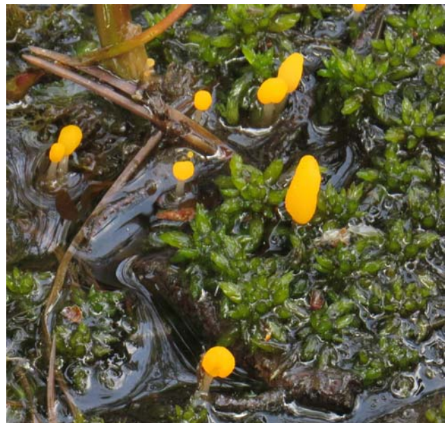
Svampen Mitrula paludosa , klubbmurkling, tämligen allmän, växer på multnande löv och pinnar i bäckar, kärr.