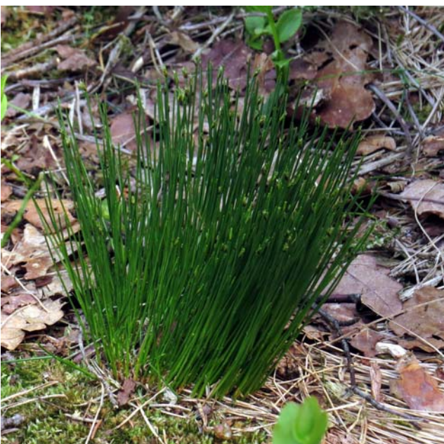
Tuvsäv Trichophorum cespitosum breddar ut sig på skogsstigar

SUMMA: Blåmes 1, Bofink 3, Drillsnäppa 1, Fiskgjuse 1, Gransångare 1, Grönsiska 3, rönsångare 2, Gärdsmyg 1, Kanadagås 2, Koltrast 1, Korp 3, Kungsfågel 1, Lövsångare 10, Nötväcka 1, Rödhake 2, Skogsnäppa 1, Svarthätta 3, Svartvit flugsnappare 2, Talgoxe 1, Taltrast 1, Tjäder 1, Trädpiplärka 1 = 43 ex av 22 arter