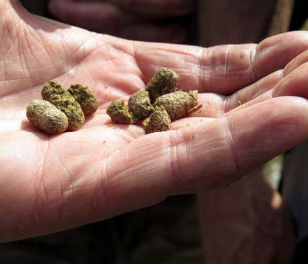
... nämligen något som torde vara järpskit.