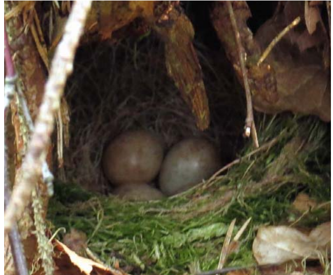
Ett annat naturfynd: småfågelbo på marken

vill återvända, fördelen med denna vandring var ändå att vi kom på vart vi kan ta vägen för att börja bekanta oss med detta stora skogsområde. Lite enkla rundfrågor visade att de flesta hade varit här "men det var för hundra år sedan" som man säger.