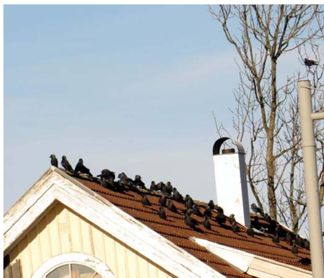
Kajorna samlades på taket vid busshållplatsen.