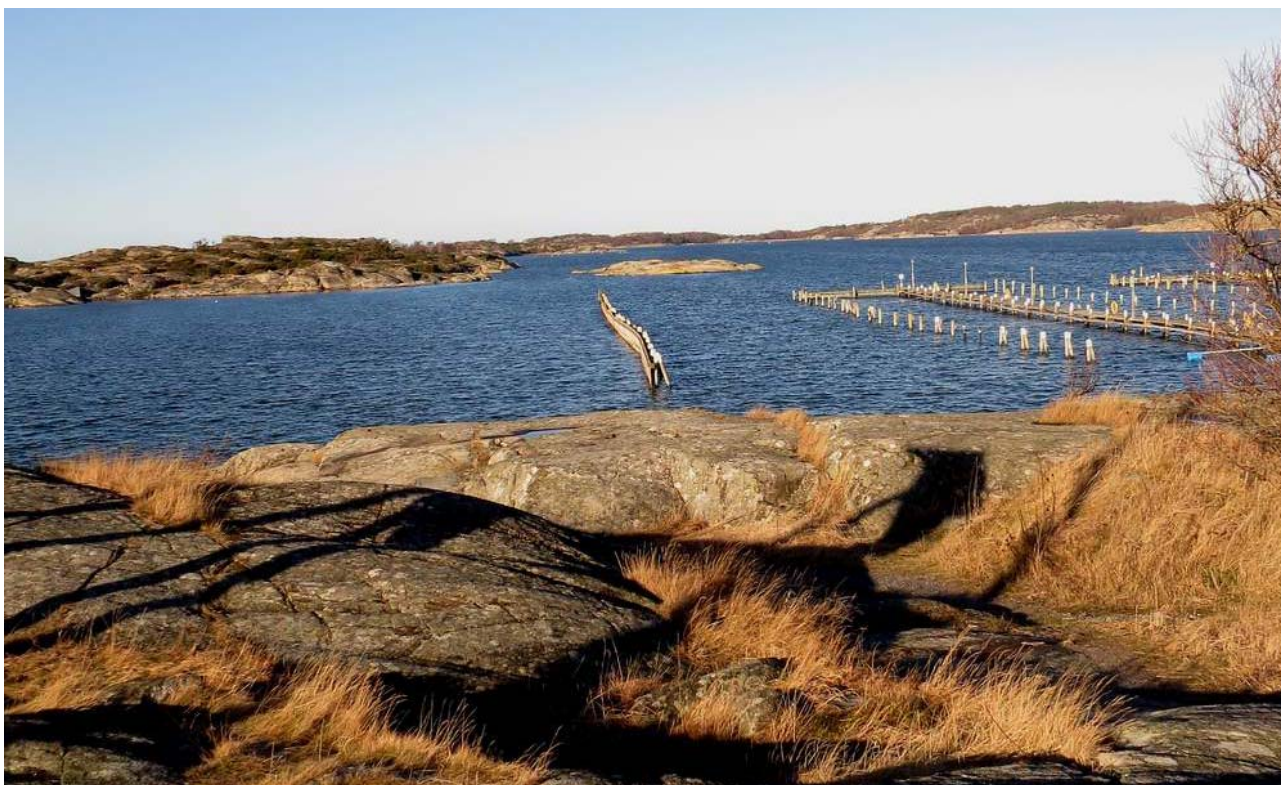
Utsikt mot norr, där Kungsviken på Stora Amundön skymtar i fjärran.