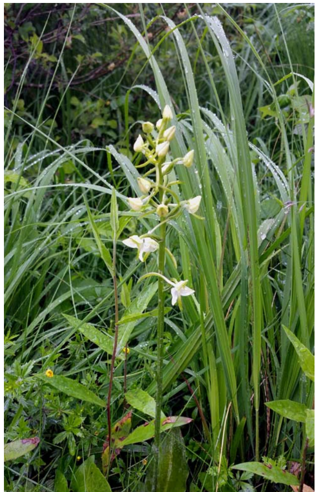
Grönvit nattviol växte efter vägen till Björsjöås.

Vi fikade uppe vid ruinerna efter Björsjöås där det funnits dokumenterad bebyggelse sedan 1560. Vi fick veta var torvladan låg, viktig byggnad eftersom ved knappast fanns som bränsle. Bränneri och potatiskällare fanns också. Här finns mycket information med skyltar för den som vill återvända hit.