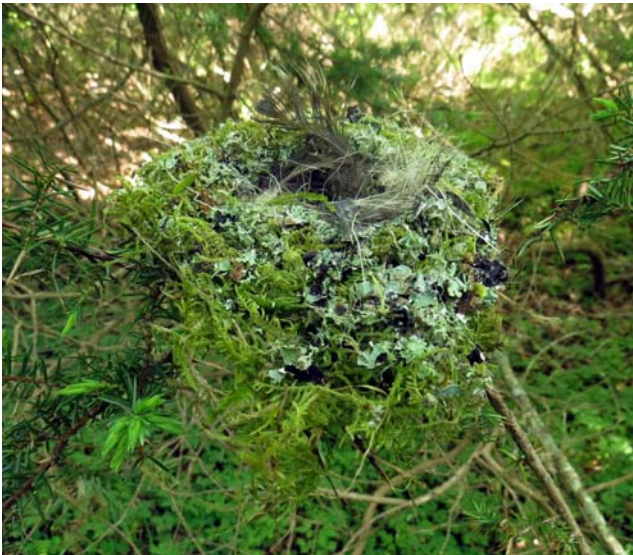
Någon fann ett bofinkbo på stigen, plockades upp, sattes att posera; syns knappt!