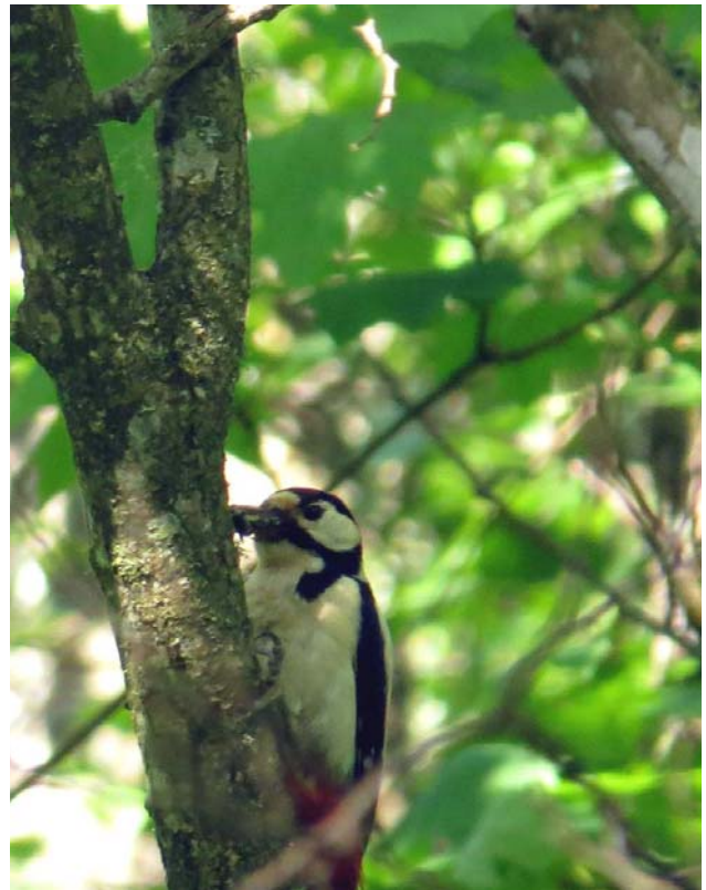
Hackspetten hade nu ganska bråda dagar.