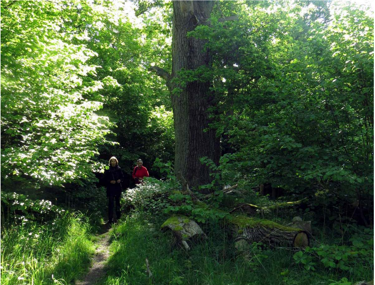
Extremt tätvuxet, sådant man inte ser på så många ställen nu för tiden.