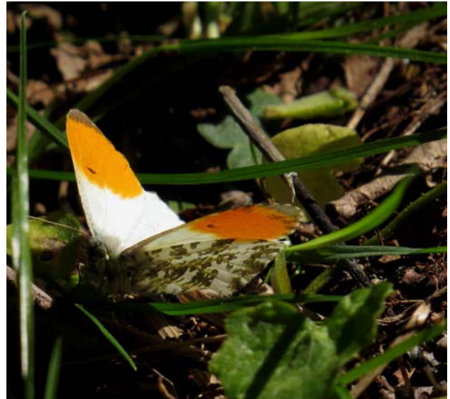
En aurorafjäril visade villigt upp sig.