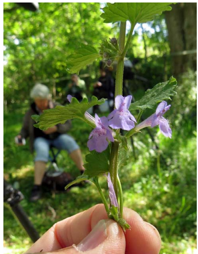
Frossört kom vi fram till att detta var, Scutellaria galericulata . Liten, vacker och blå.