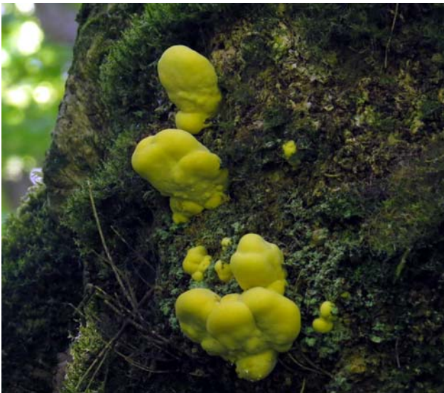
Slemsvamp, myxomyceten trollsmör vill jag minnas att detta var. Någon däremot?