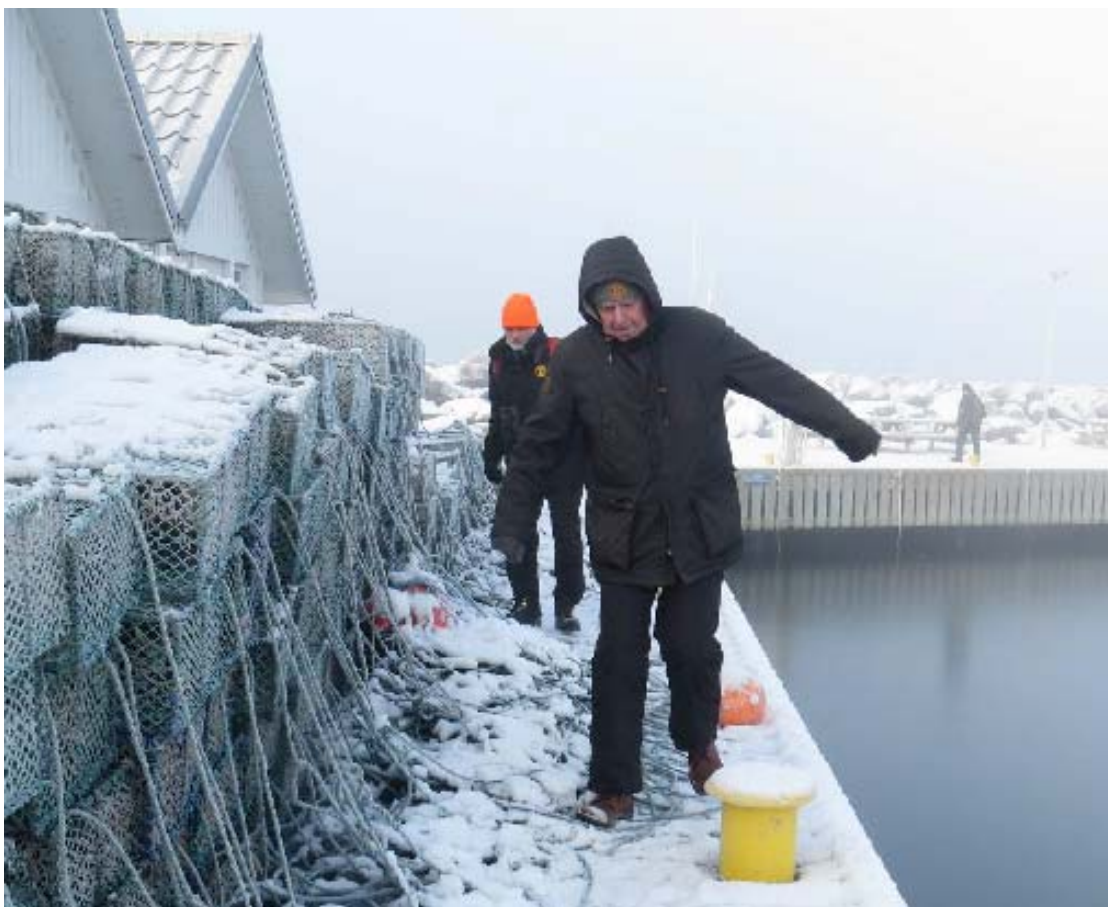
Sades vara mjårdar för havskräfcefångst, dock lite slarvigt placerade med risk att fastna och hamna i hambassängen... men vi klarade det.